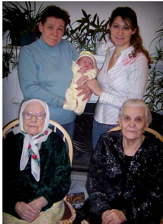
Представители пяти поколений одной благословенной семьи

Однажды в тебе могут проснуться гены твоих родителей, прародителей