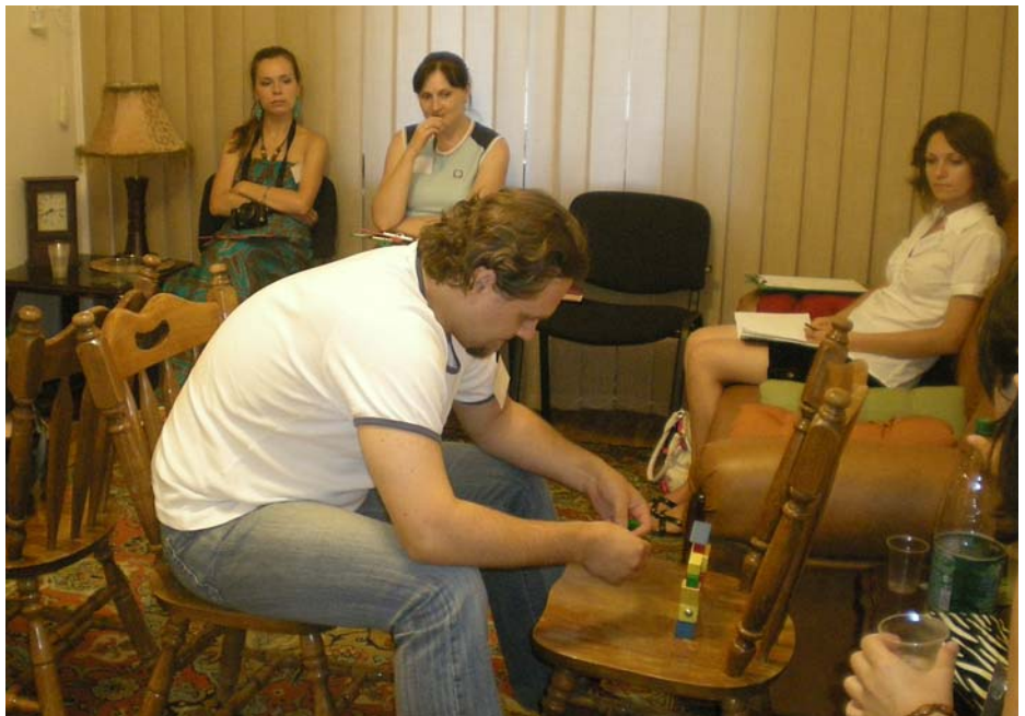
Сотрудники газеты «Семья» на семинаре-тренинге «СЕКСИвоспитание» июль 2010, г.Одесса

Каждый человек стремится к истинной близости. Если в семье ОБА супруга не имеют настоящей интимной близости: доверительных разговоров, в том числе, и о сексе, их отношения постепенно разрушаются. Проблема нарастает, а поговорить опять — то ли стыдно, то ли не знаем, как. В конечном итоге люди охладевают друг к другу, а в таком состоянии сохранить верность крайне тяжело. То, что оба супруга христиане, совершенно не гарантирует такой семье жизнь без проблем. Поскольку оба супруга живут в мире несовершенных отношений, они неизбежно будут сталкиваться с различными разочарованиями, некоторой неуверенностью в себе и т.п. Проблемы могут проявляться в более легких формах: жена регулярно отказывает мужу по причине головной боли или усталости... Муж, у которого жена шатенка, не очень высокого роста,