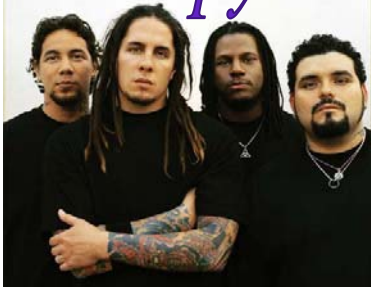
P.O.D. — одна из самых успешных христианских рок-групп нашего времени (образована в ранних 90-х). Неоднократно номинирована на премию Грэмми.

Название группы, аббревиатура от "Payable On Death" ("Выплата в случае смерти"), — это банковский термин, но группа метафорично переносит его