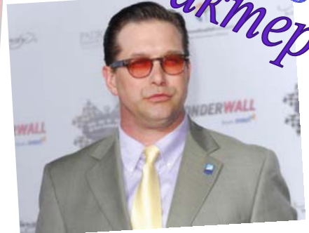
Стивен Болдуин 12.05.1966 Младший из четырех братьев-актеров династии Болдуинов. В фильмографии более пятидесяти фильмов.

Фильмография младшего Болдуина в основной своей массе сомнительна, как и его жизнь дебошира и гуляки вплоть до осени 2001 года, когда он переосмыслил все и стал христианином. В сентябре 2006 года Болдуин выпустил книгу «Необычный подозреваемый», в которой подробно осветил свою личную жизнь, карьеру, дни злоупотребления наркотиками и, в конечном счете, поведал о том, как он стал возрожденным христианином после атаки башен-близнецов 11 сентября.