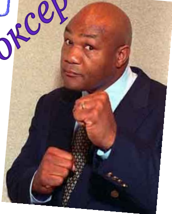
Джордж Формен 10.01.1949 Чемпион мира Чемпион Олимпийских игр (1968) Признан лучшим боксером 1973 г.

Карьера Джо очень интересна. Он начал заниматься боксом в школе для трудных подростков и уже через три года, в 1968 году, стал олимпийским чемпионом, победив в финале советского боксера Ионаса Чепулиса.